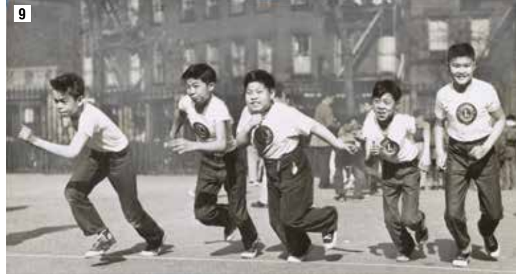
9- 1955 yılında, New York'ta Çin Mahallesi'ndeki çocuklar, Lions'un düzenlediği bir spor ve eğlence gününde yarışıyor.