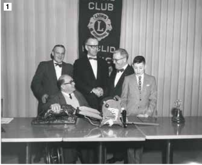
1- Yıl 1965. Ohio'daki Euclid Lion'ları, görme engelliler alfabesi kopyalayan makinayı, Roosevelt Görme Engelliler Okulu'na bağışlarken.