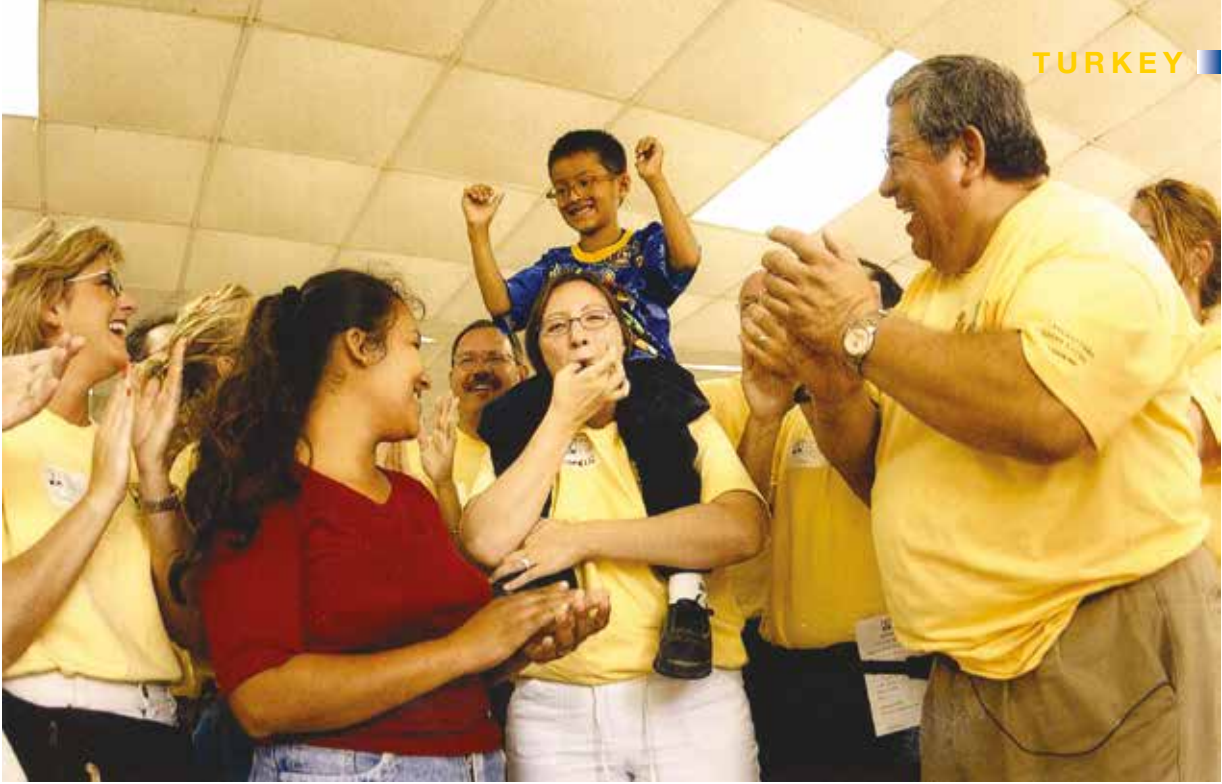
6 yaşındaki Ekvatorlu çocuk girdiği görme sınavından sonra LCIF tarafından bir çift gözlük ile ödüllendirilirken....

körlüğünü engellemeyi başardı. Nehir körlüğünü engelleyen Merck-bağışlı Mektizan'ın dozajı 1 dolardan daha az maliyete sahipti. 20 dolar kadar bir maliyet ile katarakt ameliyatı mümkün kılındı. SightFirst projesinin ilk 15 yılında, 20 milyon insanın görme kaybı riski engellendi. SightFirst projesinin yararları yıllarca devam etti. Bu proje ile 207 göz kliniği tesisi kuruldu, 314 tesis, ekipman bağışı ile desteklendi ve 83,000 civarında göz bakım uzmanı eğitildi.