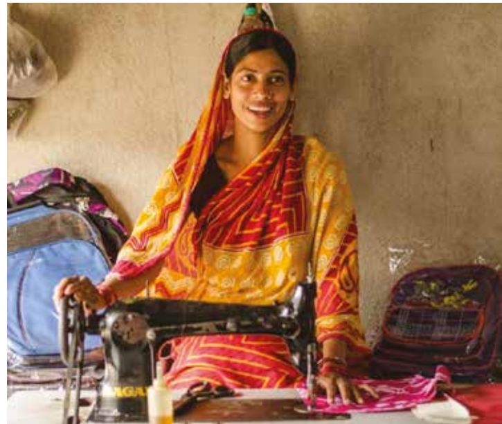
Sağlanan krediler, kadınların ailelerini geçindirmelerini ve yoksulluk çemberini kırmalarına imkan sağlıyor.

LCIF'in minik girişim kredi programı hakkında daha detaylı bilgi için sitesini ziyaret edebilirsiniz; lcif.org.