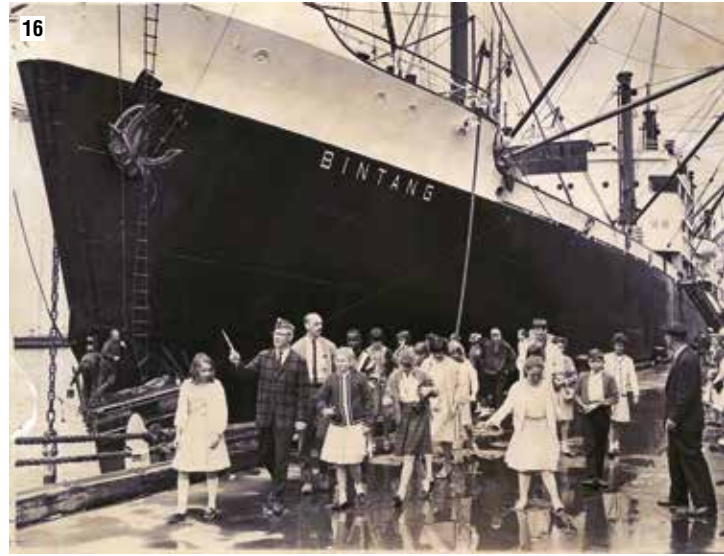
16- 1965 yılında, Minneapolis'deki Pillsbury Yerleşim Evinden gelen çocuklar Lionların Duluth'a tertiplediği gezi keyfini yaşıyor.