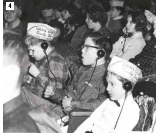
4- Yıl 1962. Görme engelli gençler, Illinois Lions kulübünün Medinah Tapınağında düzenlediği sirk gösterilerinde eğlenirken.