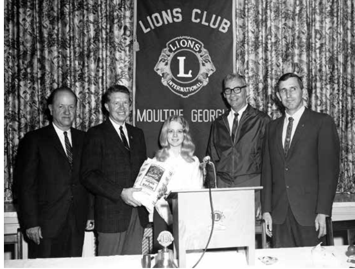
Başlık: Jimmy Carter'ın Georgia'daki bir Lions kulübüne Genel Yönetmen ziyaretinden alınmıştır.

Başkan olarak, Beyaz Saray'da birçok Uluslararası Lions Başkanı ile biraraya gelme fırsatı elde ettim. Ne zaman bir sivil toplum kuruluşu ile görüşmem istense, örneğim Lionlar olmuştur.