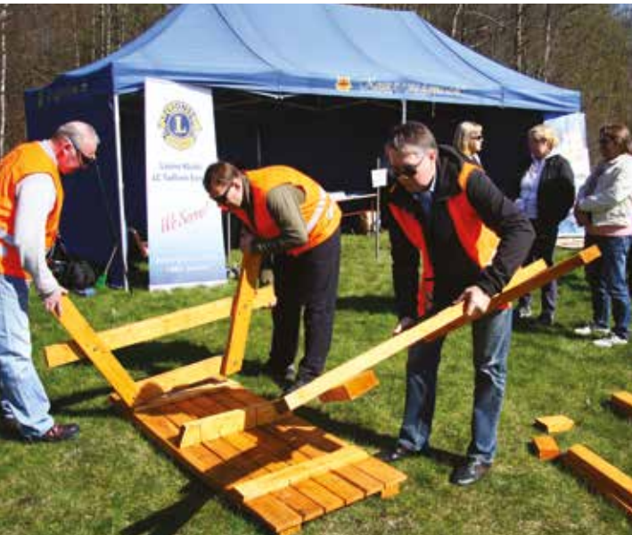
Lionlar Tallinn Hayvanat Bahçesi'nde piknik oturakları inşa ettiler.